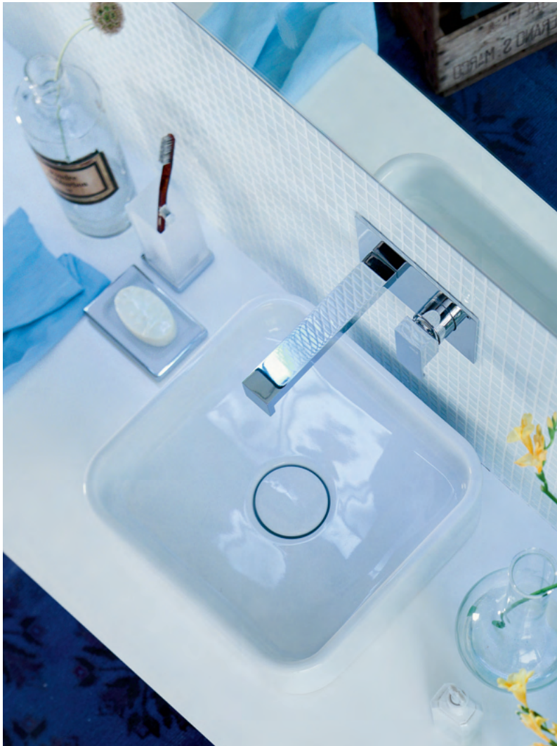
Fig. 6 - 7